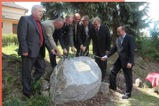
Poklepání na základní kámen dostavby domovu důchodců v Kyjově

MSO servis spol. s r.o. Svatoborská 591/87 69701