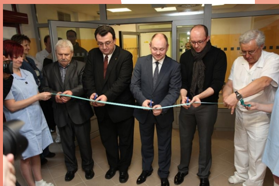
Slavnostní otevření interní nemocnice Kyjov

Našimi zákazníky jsou především města a obce, školy a bytové správy.