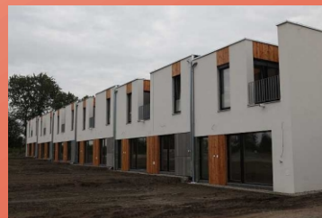
bytové domy-DMG Hodonín