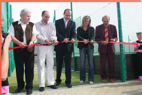
Slavnostní otevření školy Kyjov

MSO servis spol. s r.o. Za humny 20 Kyjov 69701