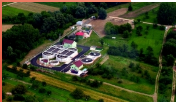
čistírna odpadních vod ve Strážnici

Stěžejní zakázkou v tomto hospodářském roce byla výstavba čistírny odpadních vod pro Vodovody a kanalizace Hodonín. Projekt je realizován za provozu s postupnou rekonstrukcí stávající čistírny odpadních vod. Přes technickou složitost takového postupu se podařilo splnit termíny realizace a projekt byl předán investorovi. Za vzornou realizaci tohoto projektu byla naše firma oceněna v soutěži o stavbu roku v sekci vodohospodářských staveb.