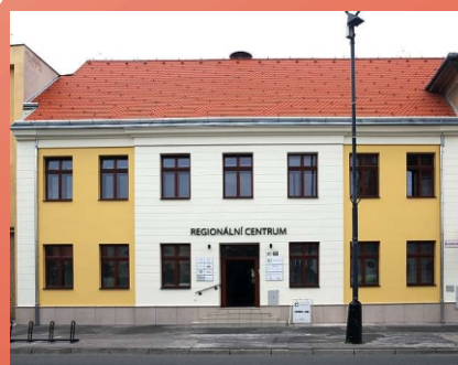
Dům č.p 27 Hodonín