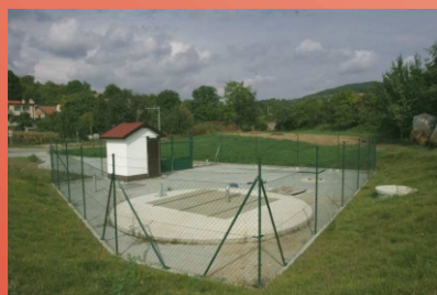
výústní objekt kanalizace v Bohuslavicích

MSO servis spol. s r.o. Za humny 20 Kyjov 69701