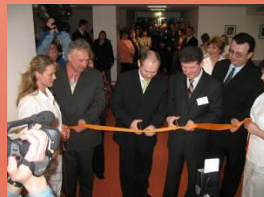
slavnostní otevření pavilonu nemocnice Hodonín