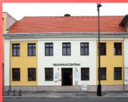
Dům č.p 27 Hodonín