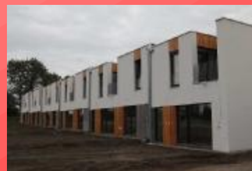
bytové domy-DMG Hodonín