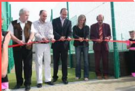
Slavnostní otevření školy Kyjov

MSO servis spol. s r.o. Za humny 20 Kyjov 69701