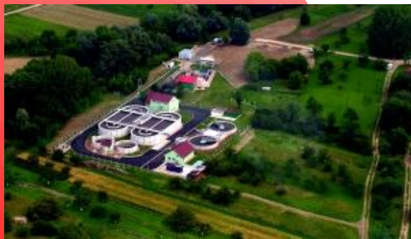
čistírna odpadních vod ve Strážnici

Rozsahem největší zakázkou v tomto hospodářském roce byla výstavba základní školy v Dambořicích a stavby průmyslového vybavení pro Poličské strojírny. Další velkou zakázkou, která je rozpracovaná i pro další období je odkanalizování obcí dobrovolného svazku Velička.